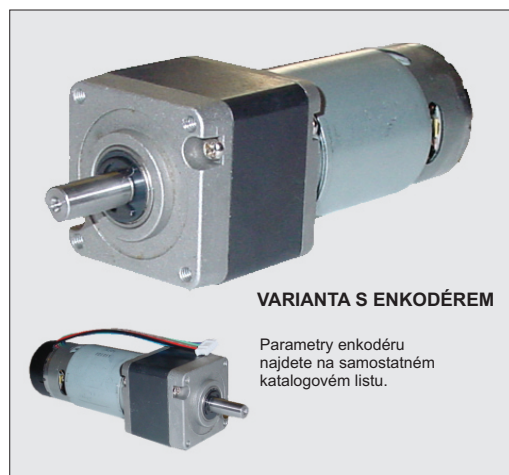
VARIANTA S ENKODÉREM

Parametry enkodéru najdete na samostatném katalogovém listu.